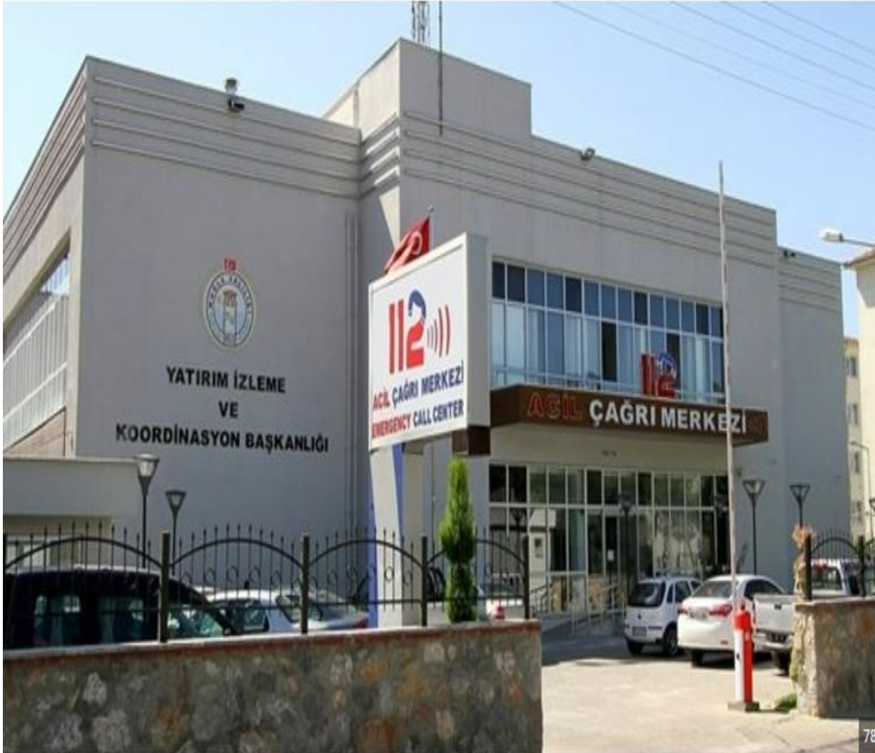
BİNANIN DIŞ CEPHEDEN GÖRSELİ