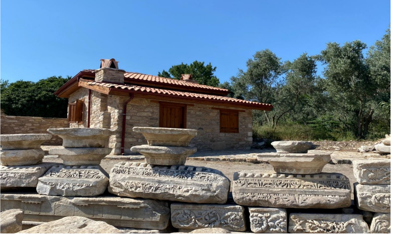
Muđla ili Milas ilesine 39 km uzaklıkta Kapıkırı Ky sınırları iinde bulunan Herakleia Antik Kenti