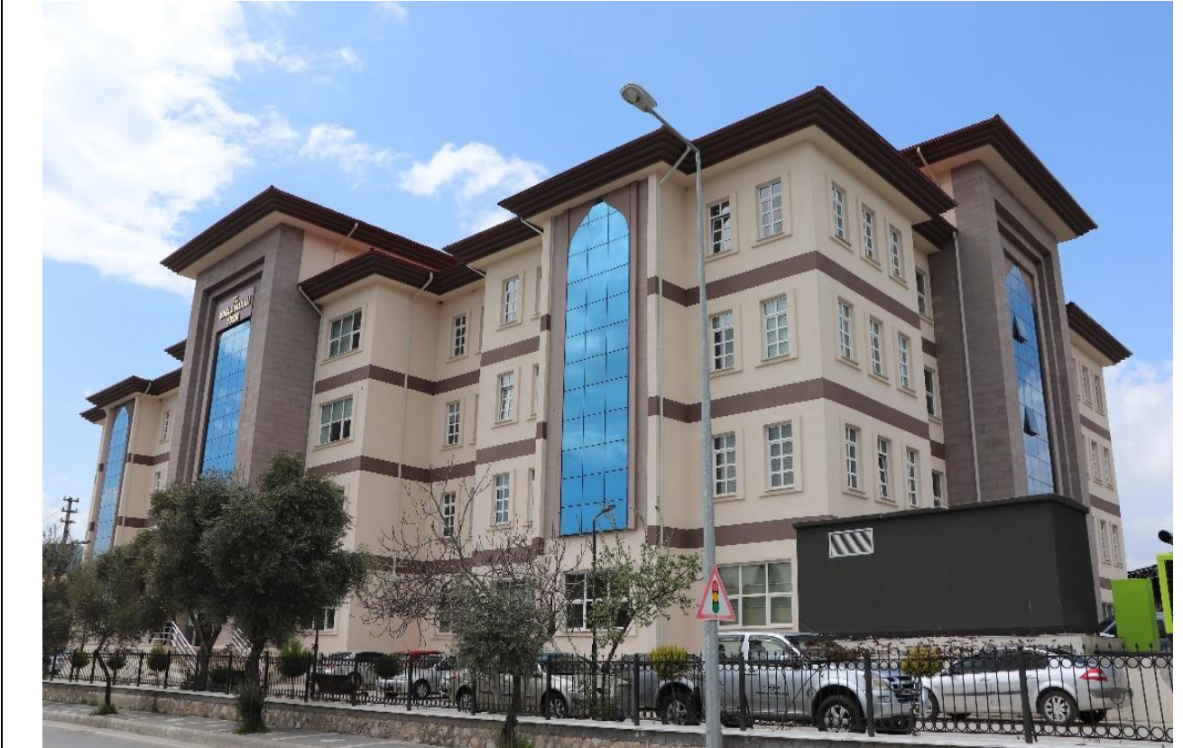
BİNANIN DIŞ CEPHEDE GÖRSELİ